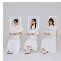
LIVE identity 盤