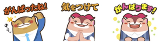
団体専用スタンプ（一例）

全体チャットまたはグループチャット内にスタンプを送信できます。リアクションスタンプより大きく表示されます。