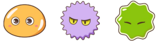
オリジナルキャラクターの“腸内細菌”たち

全9種類のうち8種類の住民キャラクターは、依頼の達成のほか、アプリ上の健康コラムの確認などで開放され、マップ上に出現します。また、最終住民キャラクターは1体目～8体目までの依頼を達成することで出現します。