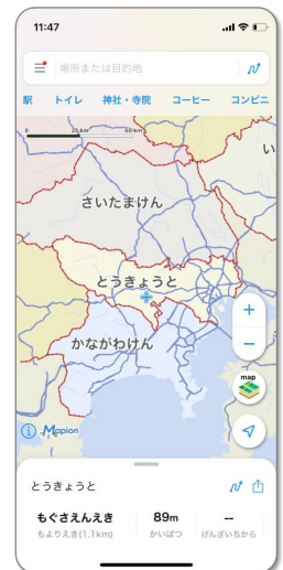
首都圏（東京都、神奈川県、埼玉県）