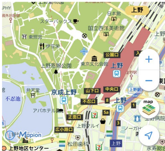
標準（デフォルト）マップ