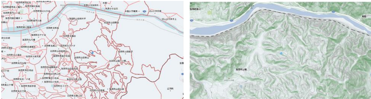
〈境界にも山あり谷あり賞〉の京都府木津川市加茂町付近を地図マピオンの「地形図」でみたところ

今回の企画のように境界線を愛でていただけることは、とても幸せなことだと感じることが多いです。人間が存在する限り、境界線は無くならないのかもしれませんが、その境界線を愛でて、境界線を気楽にお散歩できる平和な世界になってほしいと、この企画を通して強く感じました。