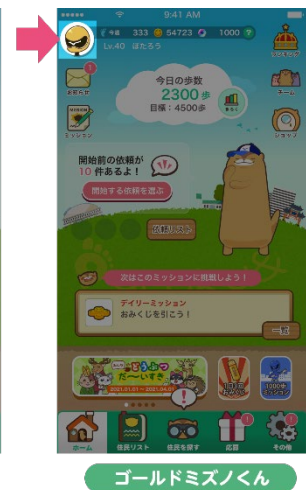
ゴールドミズノくん