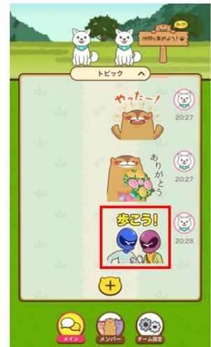
ミズノくんスタンプ