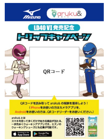
掲示QRコードイメージ

※「ポタストーン」は①最大3つまで住民キャラクターの依頼を同時に受けられる、②遠くの住民の話が聞ける、③失敗した依頼の時間を延長できる機能に使用します。