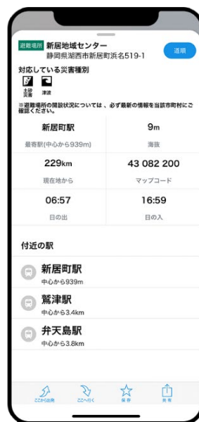
緊急避難場所詳細情報