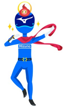
▲スーパーミズノくん