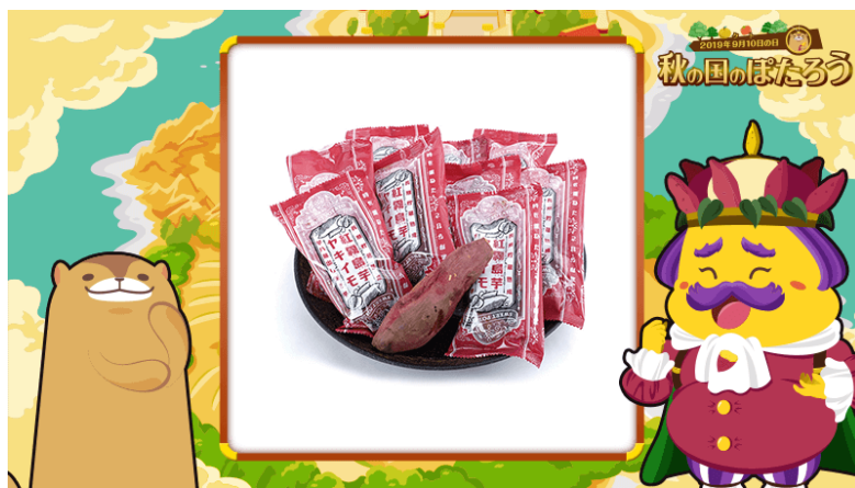
キャラクターに合わせた豪華賞品をご用意しております

今回のキャンペーンでは、「aruku&」を通じて季節感を感じていただきながら、食欲の秋にちなんだ賞品の抽選にご参加いただくことで、ユーザーの皆さまのウォーキングをより楽しいものにすることを目指しています。この機会に是非「aruku&」をご利用ください。